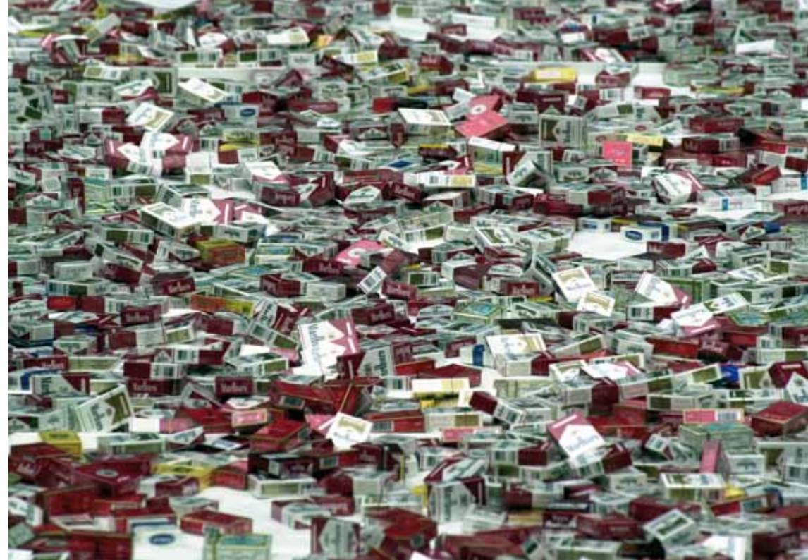
Destruction de cigarettes

Elle contribue donc, en s'opposant aux risques de fraude sur le commerce international, à la sécurité des citoyens, préserve l'environnement, défend les consommateurs et soutient l'économie légale.